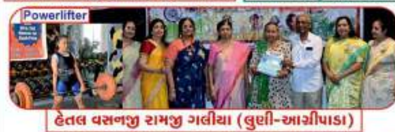
દેતલ વસનજી રામજી ગલીયા (લુણી-આગીપાડા)